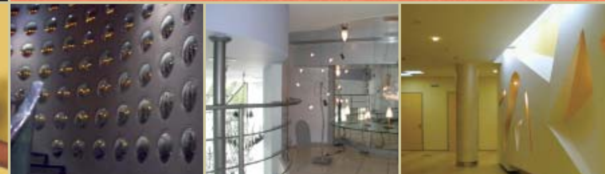
Toisen Pallas-kerroksen levitys